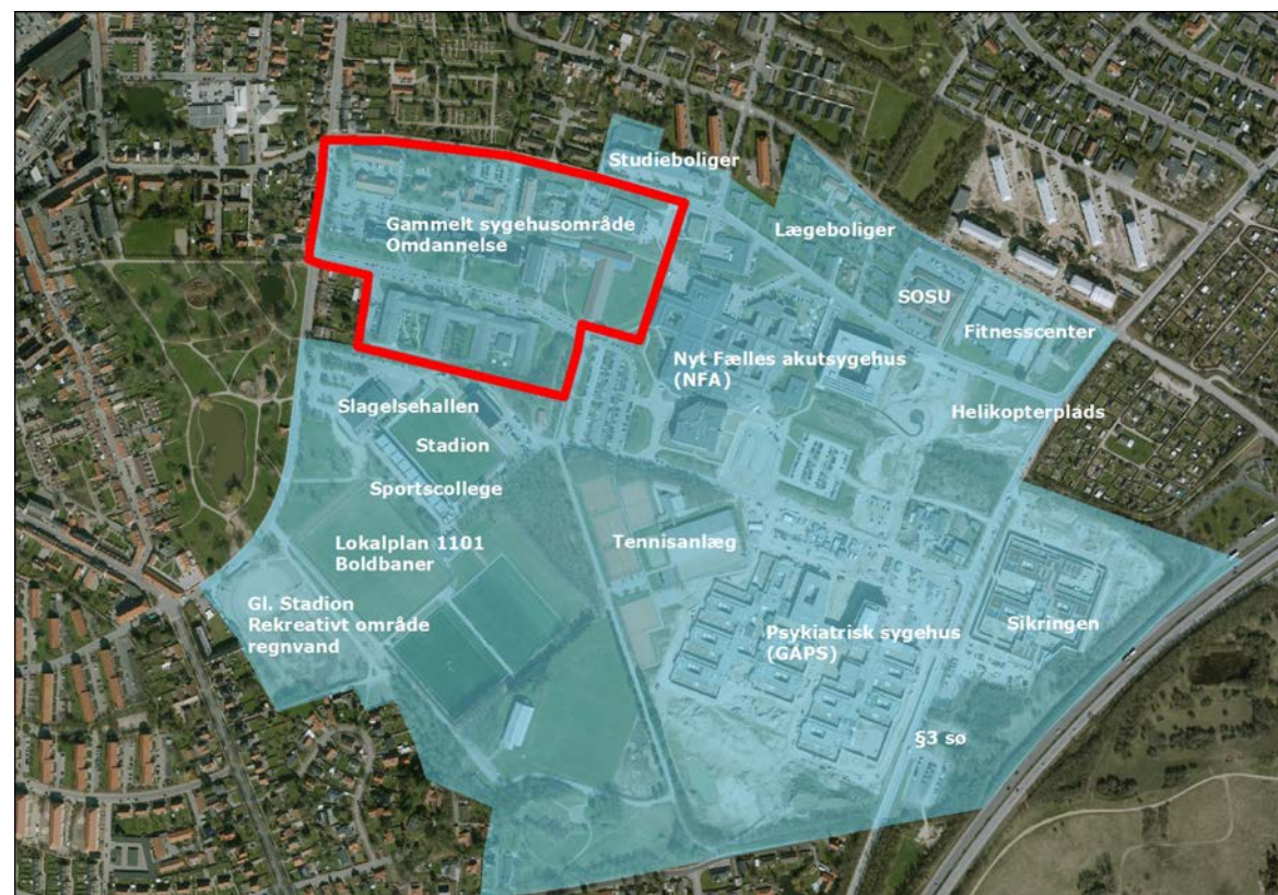
Oversigt over sygehusområdet

Den tidligere sygeplejeskole på Ingemannsvej er ombygget til 144 studieboliger og indviet oktober 2016.